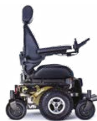
VERT MILITAIRE - JANTES CHROMÉES

«NOUS CRÉONS DES FAUTEUILS ROULANTS SUR MESURE DEPUIS 25 ANS POUR QUE VOUS PUISSIEZ VIVRE VOTRE VIE»