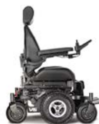
NOIR - JANTES CHROMÉES